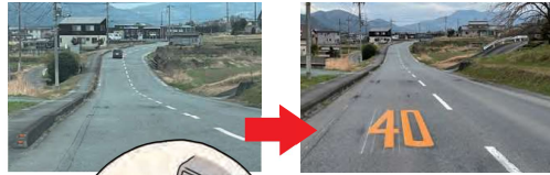
ふるさと農道 (藤岡市浄法寺)