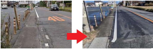
前橋長瀬線・ファミリーマート藤岡神田店前