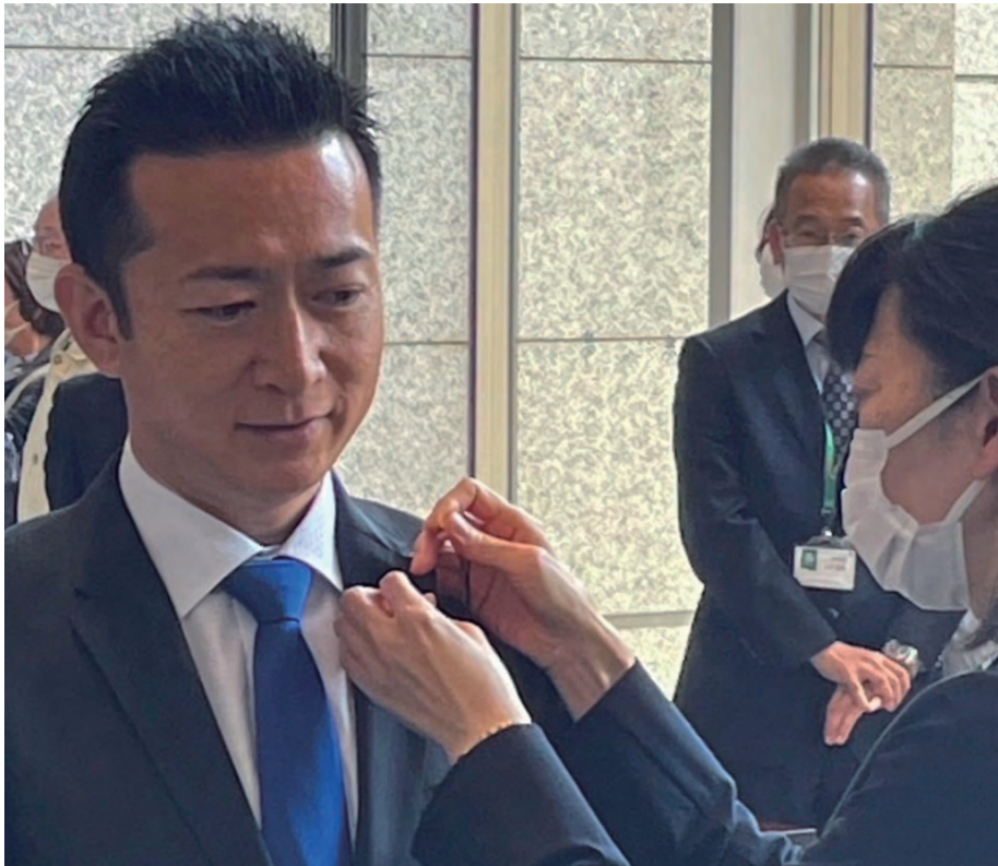
5月10日に初登庁。職員から議員バッヂの交付を受ける